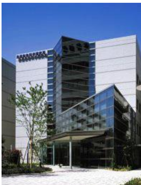
東京都港区白金にある大村智記念研究所

( https://www.kitasato-u.ac.jp/lisci/international/OmuraSatoshi.html )